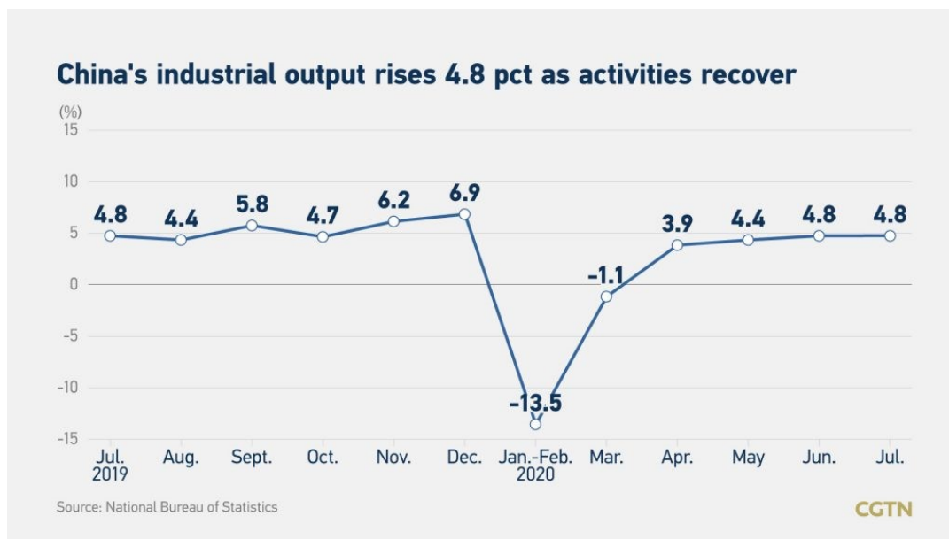
Figure 2 - Chine, un rebond spectaculaire

Ce rebond tient au succès de la campagne sanitaire. Celle-ci mérite d'être examinée. Un article publié par une organisation s'auto-situant à l'extrême gauche étatsunienne (très favorable au régime cubain et au régime vénézuélien) met le doigt sur des facteurs politiques et sociaux importants. Il passe totalement sous silence les traits totalitaires du régime chinois (la répression massive contre les Ouïghours en est une des illustrations), ainsi que la non-prise en considération par les autorités des indications sur la pandémie